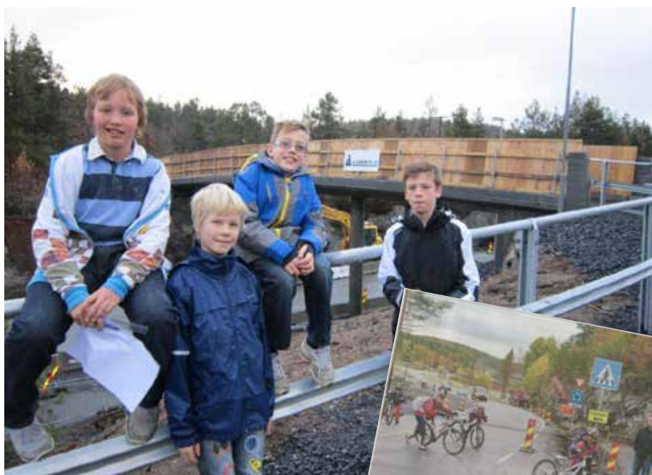
Sjetteklasseelevene ved Myra skole foran den nye gangbroa.